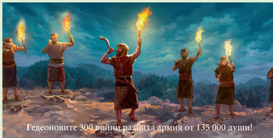
Гедеоновите 300 войни разбиха армия от 135 000 души!

Първото нещо, което Гедеон направи, бе да събори идола на Ваал. Извири с тръба, при-