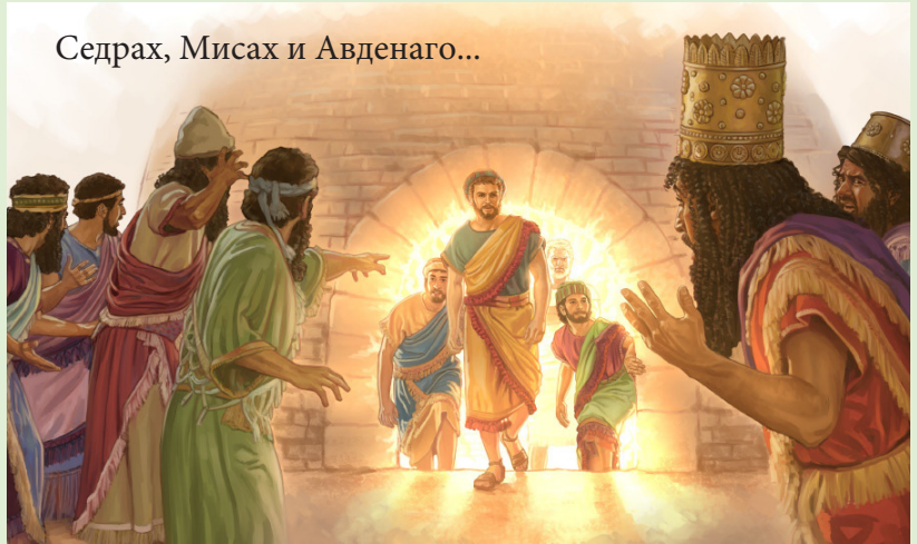
Седрах, Мисах и Авденаго...

но когато нищо такова не се случи царят и палачите погледнаха към пеща и изумени видяха Божият Син да върви сред огъня заедно със Седрах, Мисах и Авденаго! Тяхното устояване и верност към Бога ги спаси, прослави Божието име и направи един зъл цар да промени виждането си относно Бога.